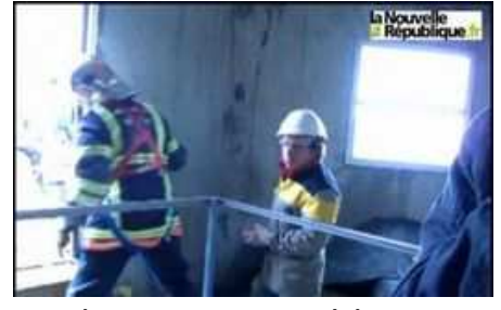
Tempête Joachim : quelques dégâts en...